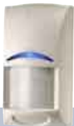
Czujki ruchu serii Blue Line

Zbudowanie kompletnego systemu alarmowego ułatwiają liczne elementy zestawu i akcesoria. Rozwiązanie to jest dokładnie dopasowane do Twoich potrzeb i zapewnia pełne bezpieczeństwo Twojego domu i firmy.