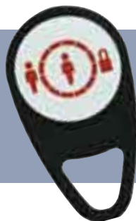
Identyfikator zbliżeniowy ułatwiający obsługę systemu

Nie są konieczne żadne specjalistyczne szkolenia, ponieważ system komunikatów głosowych wypowiedzanych w ojczystym języku prowadzi użytkownika przez wszystkie procedury obsługi. Tryb cichej pracy pulpitu sterującego umożliwia wyłączenie mniej ważnych powiadomień głosowych. Po naciśnięciu tylko jednego przycisku mogą być przekazywane alarmy bezpośrednio do pogotowia policji, straży pożarnej i pogotowia ratunkowego.