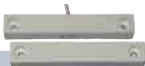
Kontakty (drzwiowe / okienne)