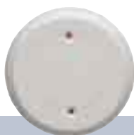
Czujki stłuczenia szkła