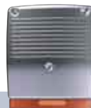
Sygnalizatory akustyczne / optyczne

Marka Bosch jest rozpoznawanym na całym świecie synonimem jakości i niezawodności. Jeśli poszukujesz bardzo łatwej w obsłudze, niedrożej centrali alarmowej, seria Easy będzie najlepszym rozwiązaniem.